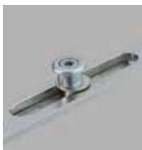
Serrure 4 galets