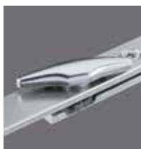
Pêne demi tour réversible