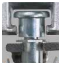
Gâche réglable en compression